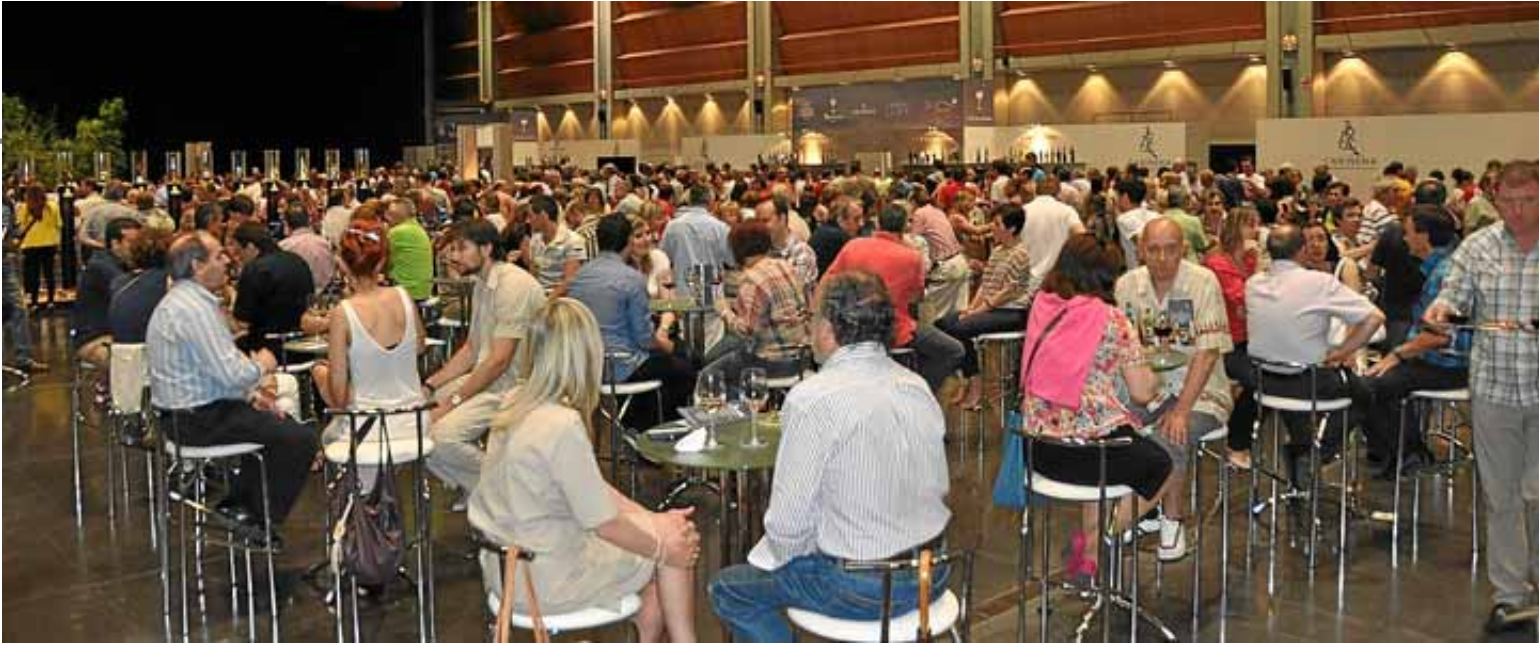
Alrededor de 5.000 personas se animaron a visitar el Salón del Vino de las Piedras el pasado mes de junio. D.O. CARIÑENA