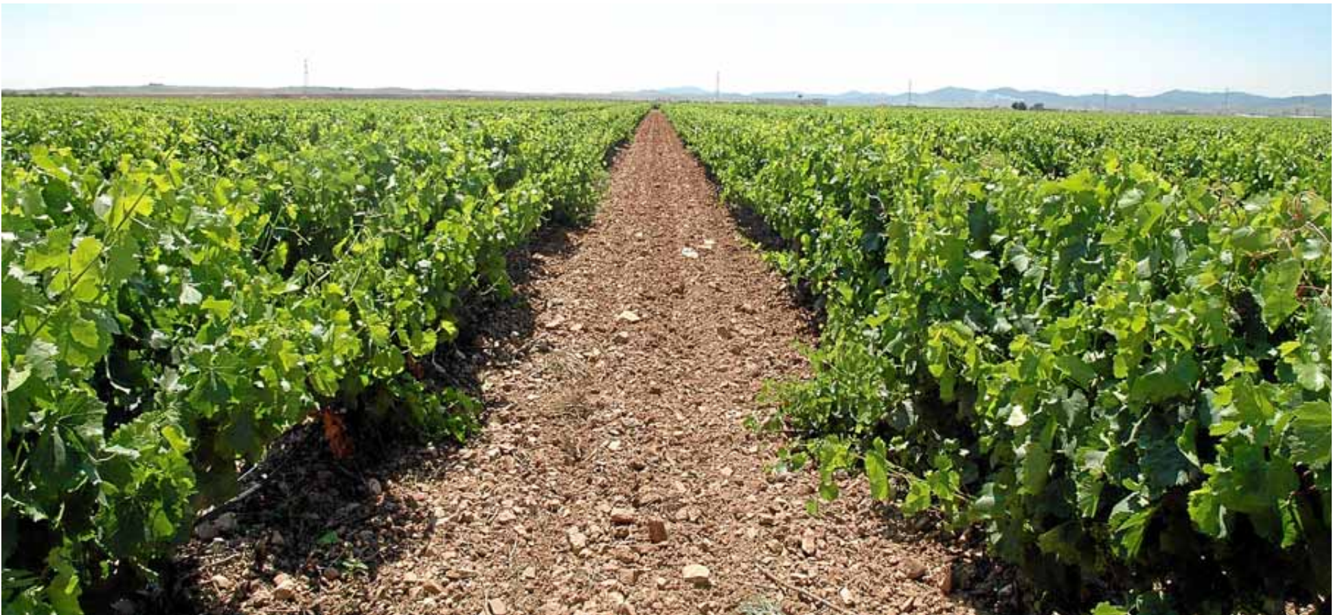
Las características del terreno y las condiciones climáticas de la zona impulsaron la vocación vitícola en la comarca de Cariñena. D.O. CARIÑENA

P or segundo año consecutivo, la Denominación de Origen Protegida de Cariñena ha puesto en marcha la campaña 'El Vino de las Piedras', después de los buenos resultados cosechados en la pasada edición.