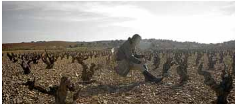
El nuevo spot de 'El Vino de las Piedras' lo protagoniza un cartero. HA

En el nuevo spot, al igual que el año pasado, se ha utilizado el recurso de la poesía. Tras la creati-