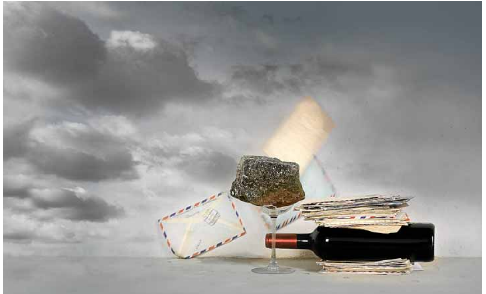
Los terrenos de la D. O. P. Cariñena destacan por sus piedras. De ahí surge la sorprendente imagen de la campaña 'El Vino de las Piedras'.

Además, por primera vez, en esta segunda edición hay cuatro vinos blancos: Val de Paniza 2011, de Bodegas Paniza; Anayón Chardonnay Barrica 2010 y Corona de Aragón Macabeo Chardonnay 2011, de Grandes Vinos y Viñedos; y Carinus Muscat 2011, de Bodegas San Valero. A estos cuatro blancos se suman dos jóvenes: Hacienda Molleda 2011, de la Bodega Hacienda Molleda; y el Torrelongares Garnacha 2011, de Bodegas Covinca.